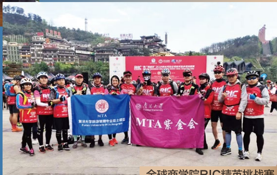
全球商学院RIC精英挑战赛