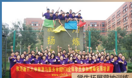
学生拓展营地训练