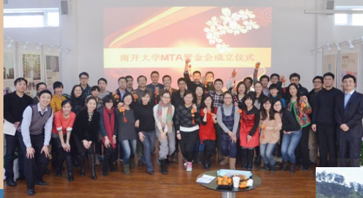
南开大学MTA紫金会成立仪式